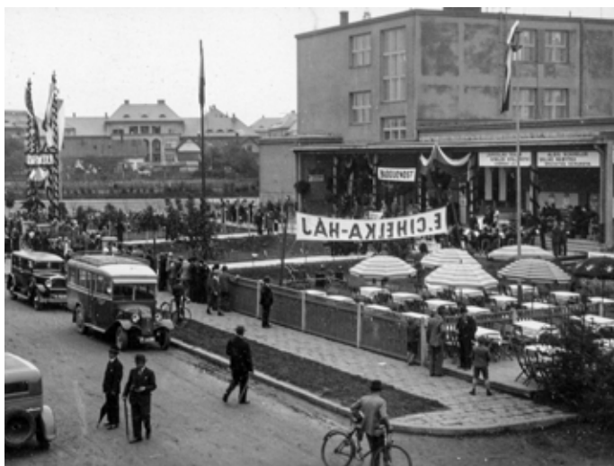
Záběr z výstavy zahrádkářů u budovy školy na Březinově ulici; 1934

V únoru roku 1959 měla pobočka svazu zahrádkářů 252 členů. Nejčastěji se scházeli v zábřežském kině Lípa a v restauraci Eliáš. Výbor pak využíval někdejší spolkové místnosti Obecně prospěšného stavebního a bytového družstva ve Vítkovicích na náměstí Gen. Svo-