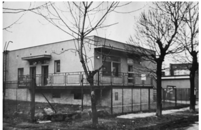
Dům zahrádkářů č. p. 2908 na České ulici; stav po dokončení v roce 1984