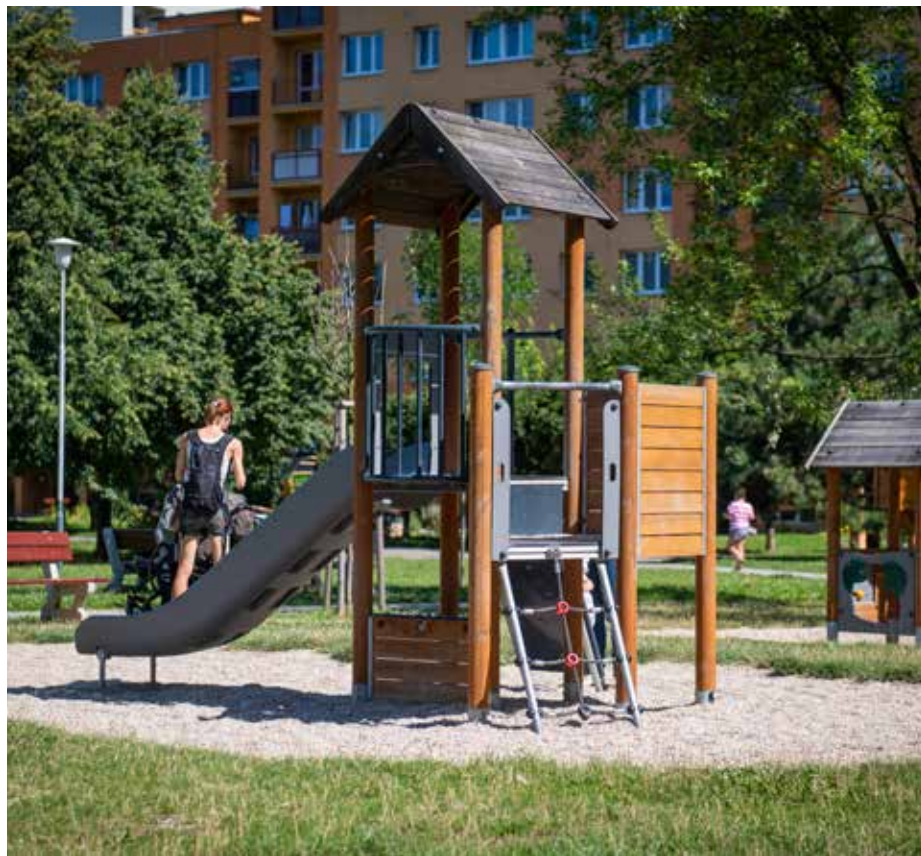
Návrh může zpestřit život za domem. Dřevěná věž pro děti je projekt z roku 2016, který v Bělském Lese slouží doposud.

Návrhy do devátého ročníku participativního rozpočtu Náš Jih je možné posílat od 1. května do 30. června. Nápaditost a originalitě se meze nekladou. Jižané mohou své nápady přihlásit online na webu: nasjih.cz nebo prostřednictvím formuláře, který je k dispozici na následujících stránkách Jižních listů či na vyžádání na radnici.