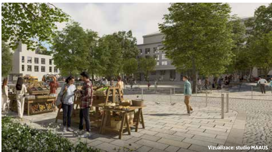
Vizualizace: studio MAUS