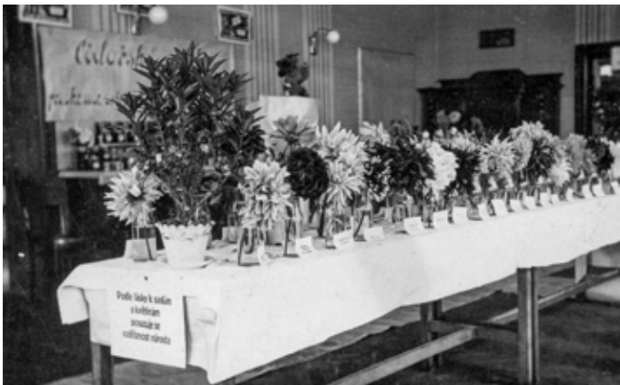
Výstava ovoce 22. srpna 1937 v restauraci Eliáš

V 70. letech 20. století byl název organizace upraven na Český zahrádkářský svaz. Po dobu 70. a 80. let patřilo sdružení k neaktivnějším v rámci tehdejšího obvodu Ostrava 3 a přispívalo k založení a rozvoji blízkých zahrádkářských osad (např. Odra v Zábřehu). K roku 1979 bylo v zahrádkářském svazu registrováno 678 členů, kteří se zapojovali do pěstování sazenic, nákupů stromů, hnojiv, semen, pořádání přednášek a zájezdů.